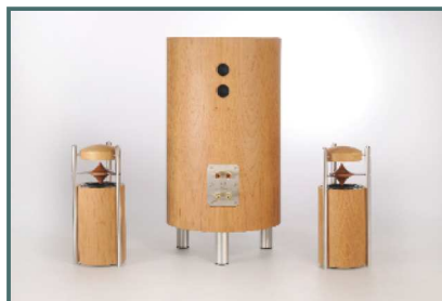
System Kirschbaum ohne Ständer