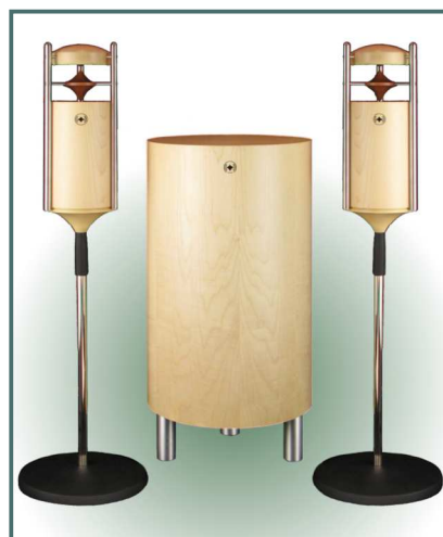
System Ahorn auf Chromständern